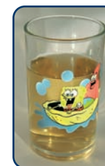
Ook appelsap is een zuur tussendoortje

Behalve goed poetsen, napoetsen en controle, is het belangrijk dat u goed op de voeding van uw kind let. Zowel suiker (gaatjes) als zuur (erosie) kunnen het gebitt beschadigen. Beperk daarom het aantal eet- en drinkmomenten tot maximaal zeven per dag. Drie keer een maaltijd en maximaal vier keer per dag een tussendoortje. Het gaat niet alleen om hoe véél zure producten uw kind eet en drinkt. Het gaat vooral om hoe vaak, hoe lang, de tijdstippen en de manier waarop dat gebeurt. Tanderosie is slijtage van het tandglazuur door zuurinwerking. Het is een sluipend proces dat niet gemakkelijk te herstellen is.